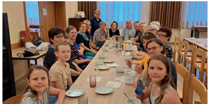
Gemeinsames Speisen nach dem Biblischen Kochen.