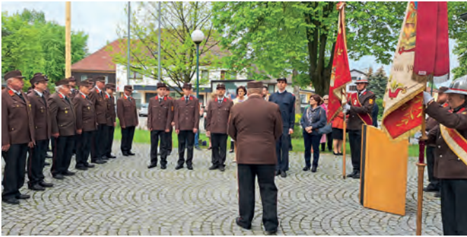
Die Jungfloriani-Angelobung am Markersdorfer Kirchenplatz.