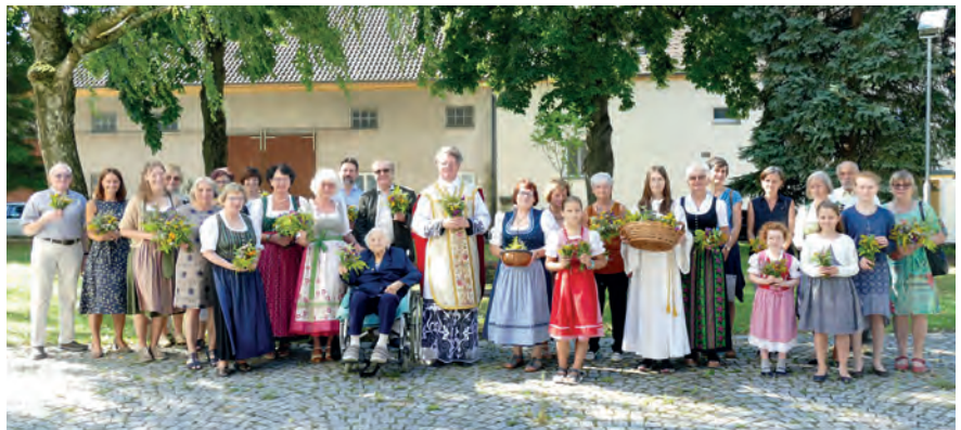
Die Festmessen-Besucher mit den herrlich duftenden Kräuterbüschen.

„So lasst uns durch die Straßen tragen, den Herrn und König ....“ - heißt es im Lied, das gerne beim Fronleichnamsumzug gesungen wird. Der langjährigen Tradition entsprechend wird auch bei uns noch der Herrgott zu vier Altären im Ortsgebiet von Haindorf getragen. Die Feuerwehrmänner bereichern den Umzug mit ihrer Präsenz und die Blasmusik sorgt für einen besonders festlichen Rahmen. Herzlichen Dank an die Familien, die für das Gestalten der Altäre gesorgt haben und den Knetzersdorfern für die Gesamtorganisation.