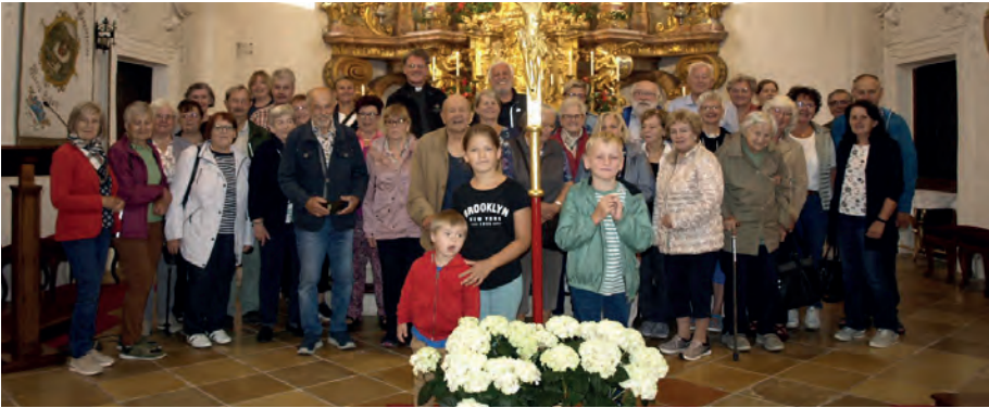
Die Wallfahrer vor dem Gnadenbild in Maria Schutz.