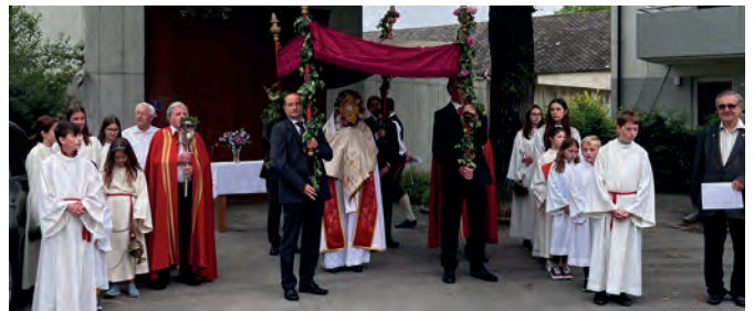
Fronleichnams-Prozession in Markersdorf.