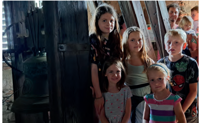
Stauende Kinderaugen bei den Glocken.